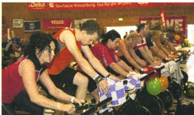
Strampeln und helfen: Ein Bild vom ersten Wasserburger Badriathlon. Am 22. Januar geht es in die zweite Runde.

Nach der erfolgreichen Premiere des Wasserburger Badriathlons im September 2009 – 150 Teilnehmer sorgten damals für ein Spendenergebnis von 6000 Euro – geht die sportliche Benefizaktion am Samstag, 22. Januar, in die zweite Runde. Die Hälfte des Erlöses fließt in die OVB-Weihnachtsaktion „Gemeinsam für krebserkrankte Kinder“.